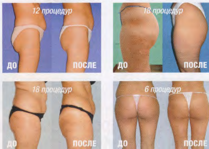
Фото пациентов, которые похудели в проблемных местах с помощью аппарата Endosphere Ak55.