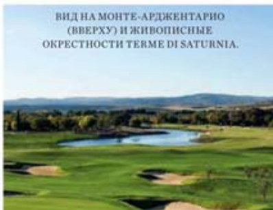
ВИД НА МОНТЕ-АРДЖЕНТАРИО (ВВЕРХУ) И ЖИВОПИСНЫЕ ОКРЕСТНОСТИ TERME DI SATURNIA.

Выглядело это действие довольно мистически. Источник находится в кратере потухшего вулкана, температура целебной воды (около 37 градусов) значительно превышает температуру воздуха. Благодаря такой разнице над